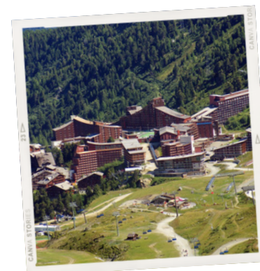
Les Arc 1800 - Séjour 2024